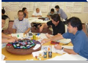
④各自で決算書作成