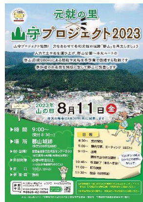
山守プロジェクト