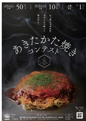
あきたかた焼き コンテスト