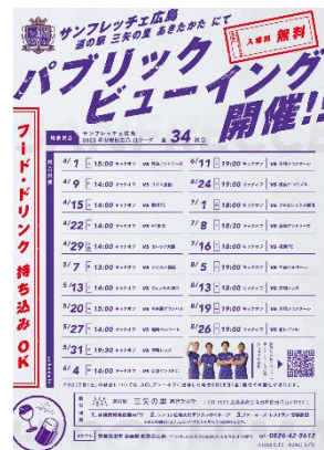
サンフレッチェ広島 パブリックビューイング

みなさんの 『こんなことがあったら楽しい!』『参加したい!』と思う アイデアをお待ちしています。